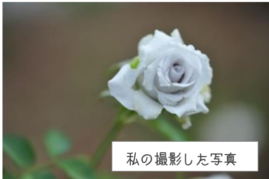
私の撮影した写真