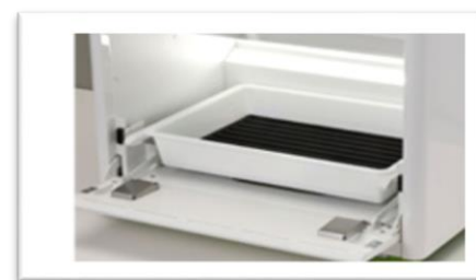
トレイの下に秤あり